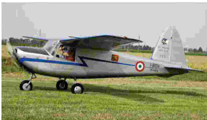
Il Macchino I-BIOH, l'MB308 ha dato le ali a centinaia di piloti nel dopoguerra