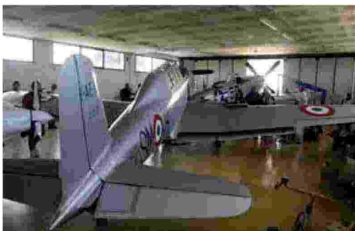
Fiat G46 e P51-D Mustang: quando si dice un "hangar da sogno"